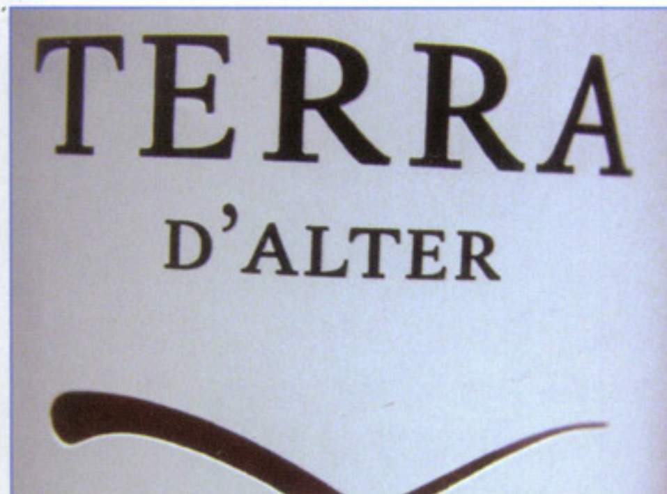
Terra d'Alter, Rosado, 2009, Vinho Regional Alentejano

Een selectie van de lekkerste wijnen die voor dit nummer geproefd zijn, in drie prijscategorieën.